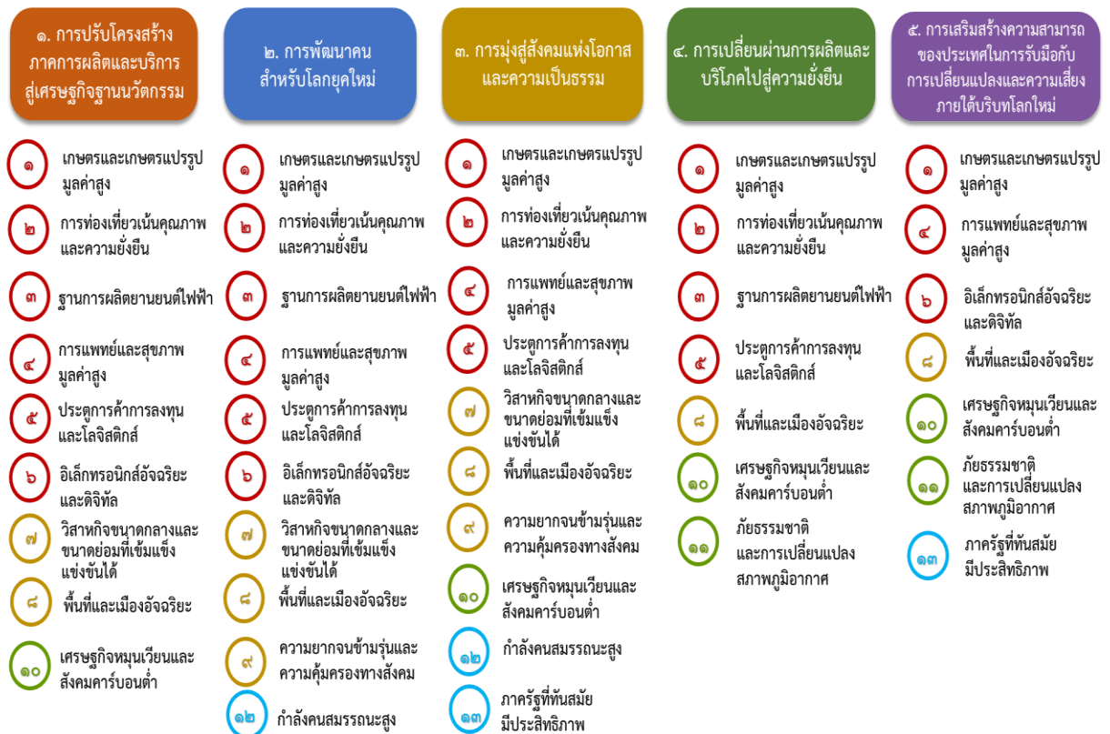
แผนภาพที่ 1 ความเชื่อมโยงระหว่างหมวดหมู่การพัฒนา กับเป้าหมายหลัก

ความเชื่อมโยงระหว่างหมวดหมู่การพัฒนา กับเป้าหมายหลักแสดงไว้ในแผนภาพที่ 1 โดยหมวดหมู่การพัฒนาที่กำหนดขึ้นเป็นประเด็นที่มีลักษณะเชิงบูรณาการที่ครอบคลุมการพัฒนา ตั้งแต่ในระดับต้นน้ำจนถึงปลายน้ำ และสามารถนำไปสู่ผลพัฒนาทั้งในมิติเศรษฐกิจ สังคม ทรัพยากรธรรมชาติและสิ่งแวดล้อมไปพร้อมๆ กัน ทำให้หมวดหมู่แต่ละประการสามารถสนับสนุนเป้าหมายหลักได้มากกว่าหนึ่งข้อ นอกจากนี้ การพัฒนาภายใต้แต่ละหมวดหมู่ไม่ได้แยกขาดจากกัน แต่มีการสนับสนุนหรือเอื้อประโยชน์ซึ่งกันและกัน